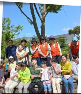
6월 15일 화랑유원지