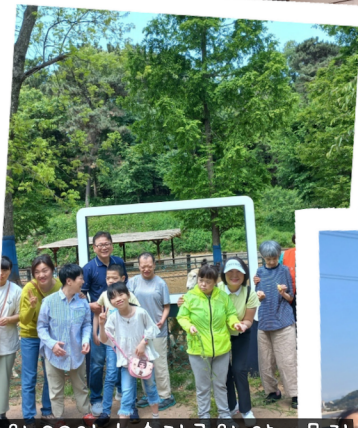
4월 23일 늘솔길공원 양떼목장