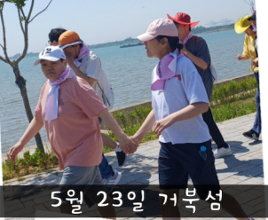
5월 23일 거북섬