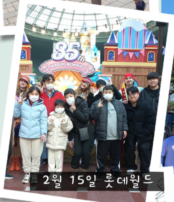
4월 15일 롯데월드