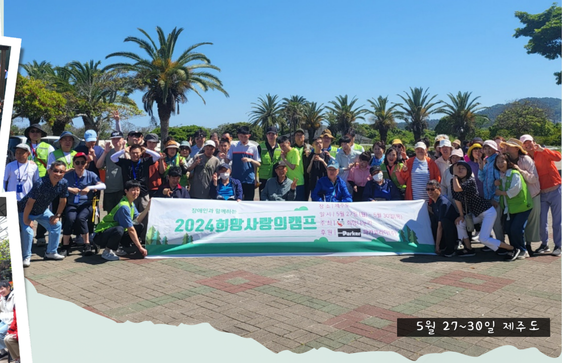
5월 27~30일 제주도