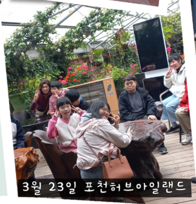
3월 23일 포천허브아일랜드