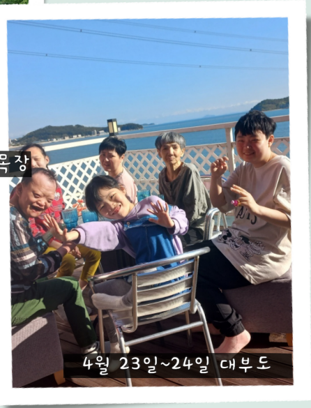
4월 23일~24일 대부도